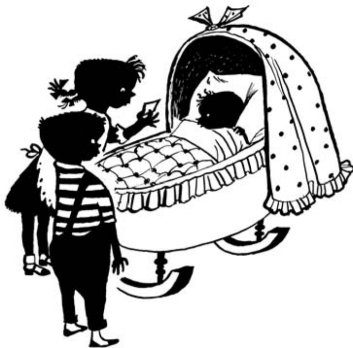
Het kindje lijkt op een varkentje, Het Parool , 29 november 1952

Zij behoort dus tot 'die waardevolle onderdelen van onze cultuur en geschiedenis die we via het onderwijs aan nieuwe generaties willen meegeven', zoals de commissie het formuleert. Schmidt staat omschreven als: tegendraads in een burgerlijk land.