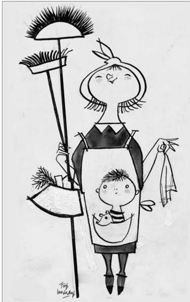
"U wenst een volmaakte hulp, maar... bent u een volmaakte vrouw?" Het Parool , 31 december 1959.

De courantiërs voegden 'aan het meer serieuze deel van hun krant een hele of halve pagina "voor de vrouw" toe, waarin breipatronen en recepten elkaar afwisselden, met als pièce de milieu bijvoorbeeld een interview met een gepensioneerde directrice van een middelbare school voor meisjes, een en ander geschreven in de eenvoudige huppeltaal waarin verpleegsters kindse grijsaards opwekken hun laxeerpilletje in te nemen'.