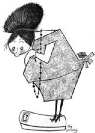
Illustratie voor de vrouwenpagina, Het Parool , circa 1950 © illustreer bv

Op pagina 7 vindt u meer bijzonderheden over de expositie in het Persmuseum, die duurt tot en met 11 maart 2007.