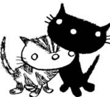
Pim en Pom, Het Parool , 15 januari 1960

Daarnaast zal er een ruime selectie te zien zijn van de illustraties