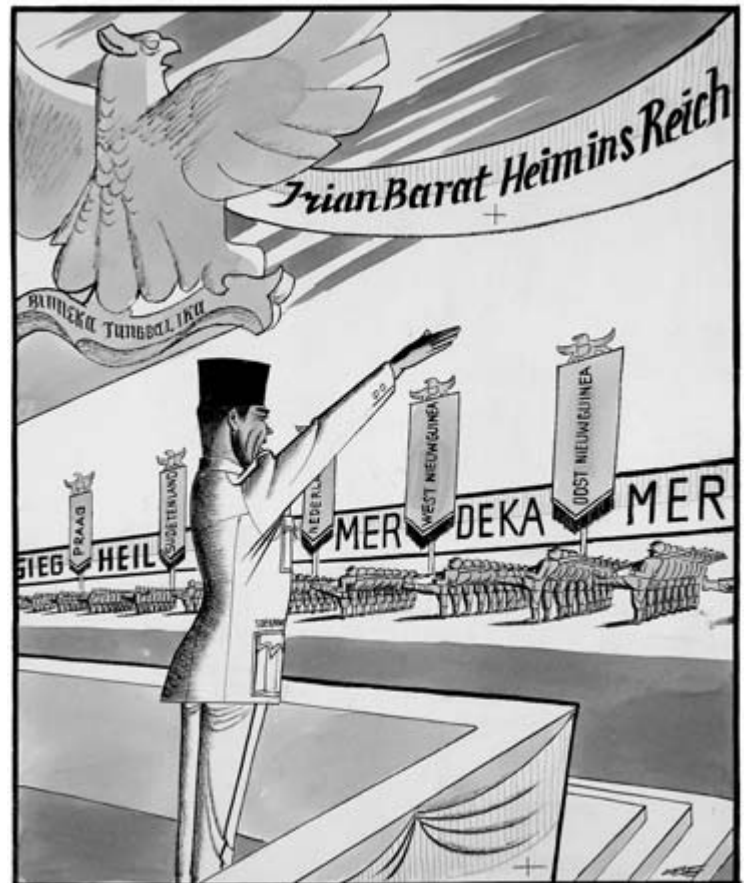
Eppo Doeve, Elseviers Weekblad , 6 januari 1962. 'Und wir fahren...!' De Indonesische president Soekarno slaat dreigende taal uit tegen Nederland in het conflict over Nieuw-Guinea. In het begin van de oorlog van 1914-1918 was 'Und wir fahren gegen England...' in Duitsland een populair lied. Deze tekening was van juni tot begin oktober 2005 te zien in de tentoonstelling 'Journalistiek in de tropen'.