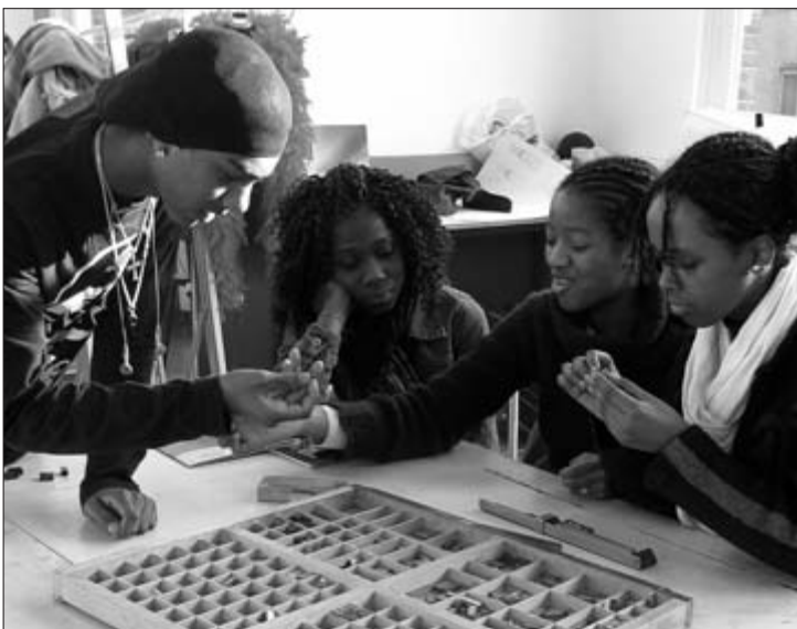
Het Persmuseum ontwikkelde vanaf 2002 een gevarieerd educatief aanbod. Rondom thema's als (foto)journalistiek, cartoontekenen, techniek en persgeschiedenis zijn interactieve lessen en workshops gemaakt voor de verschillende leeftijden en niveaus van het onderwijs. Hier zijn leerlingen aan het werk in de workshop 'ff een krant maken!'.