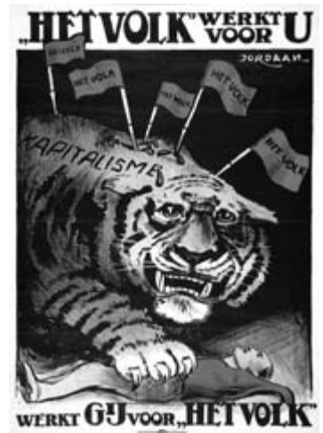
De tentoonstelling 'Léés die krant! Dagbladaffiches 1905-2005' toonde een bijzondere keuze uit de omvangrijke collectie affiches van het Persmuseum en het IISG.