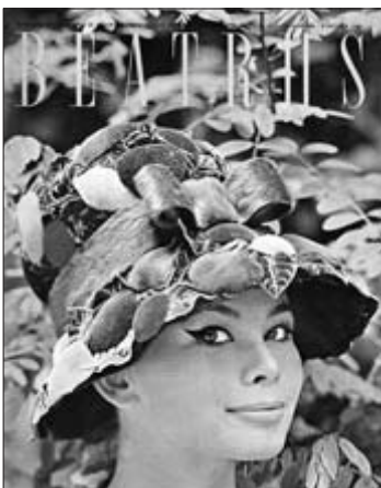
Links: In 2004 toonde het Persmuseum de tentoonstelling 'Van Zeep tot Soap. Continuïteit en verandering in geïllustreerde vrouwentijdschriften'. De expositie bood een overzicht van de geschiedenis van het Nederlandse vrouwentijdschrift vanaf de jaren dertig van de twintigste eeuw tot nu, met een blik op de toekomst.